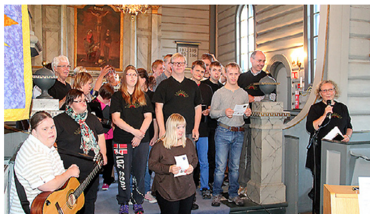
Gledessprederne med konsert i Prestebakke kirke.