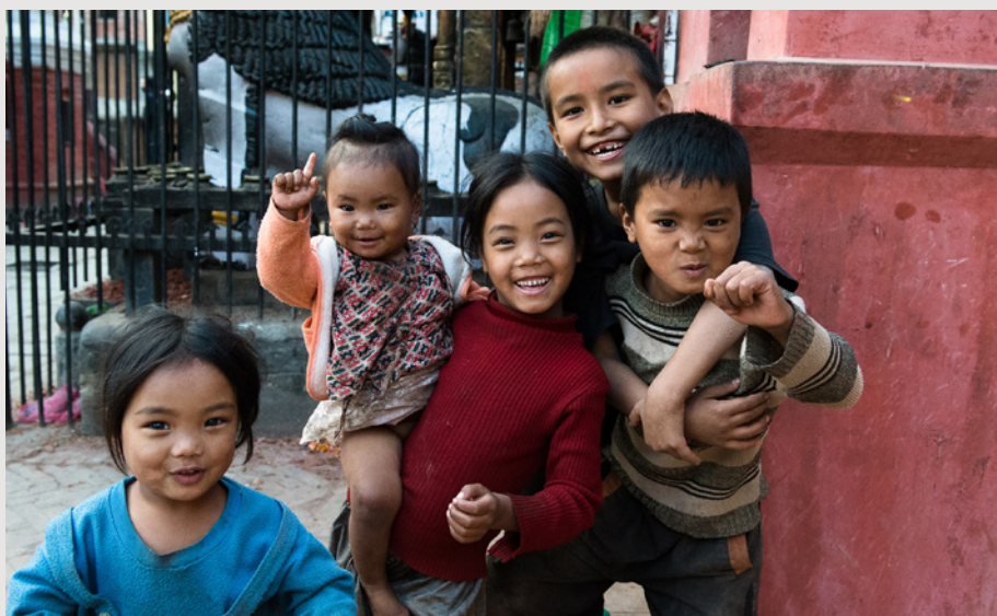
Barn i Nepal.

Det som var før er borte. For deg er bare sykdommen tilbake. Alzheimers sykdom fratar den som får den alt iv. Og etterlater bærereren i et fremmed ensomt landskap der ingen andre har adgang.