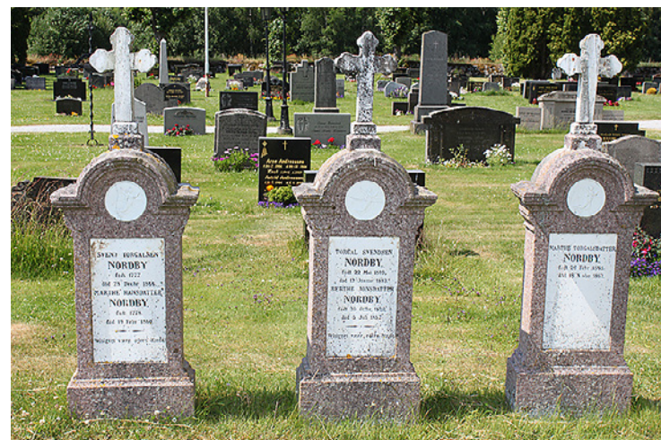
På Idd kirkegård ser vi gravminner fra ulike tidsepoker.

fram til i dag. Ingen gravminner er naturligvis bevart fra den første tiden. Da var gravene helt umerket, eller det ble satt opp en liten treplate med navnet til den avdøde. Seinere kom enkle trekreiser i bruk, men uansett råtnet disse opp i årenes løp og gras dekket etterhvert gravstedet. På Søndre Enningdalen, er kanskje den aller eldste bevarte kirkegården. En liten stavkirke stod på Kirkebøens grunn i den tidlige kristne tid. Det gudshuset er for lengst borte, men kirkegården har vært i kontinuerlig bruk