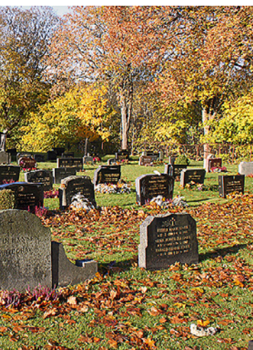
Rammegrav fra «Høyden» på Os kirkegård.

seg å være eldgamle hellekister, kan vi også komme over i terrennavn. Kvinnes «tittel» var, med svært få unntak, hustru. På Solli Gravlund på Idd stod det imidlertid, inntil for noen år siden, et gravminne over «tyende» N.N. Hennes yrke var altså tjenestejente.