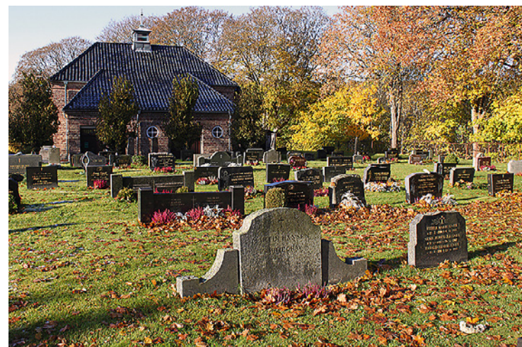
Tistedal kirkegård i høstsol.

I Haldens omegn kan vi støte på gravminner fra førkristen tid. Flere bronsealderøyser og gravhauger fra jernalderen er merket på turkartene. Steinsamlinger som viser