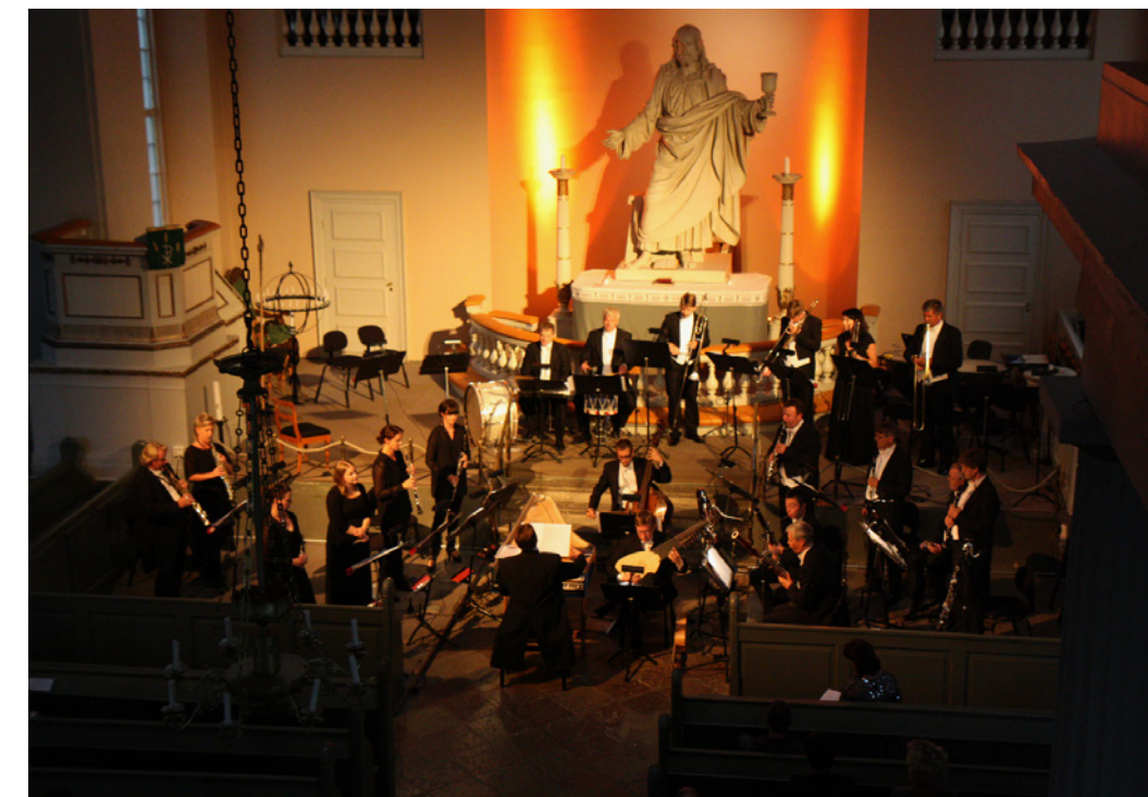
Det Norske Blåseensemble spiller i Immanuel kirke.

«Salmer fra 1814» settes opp 31. oktober og er et samarbeidsprosjekt