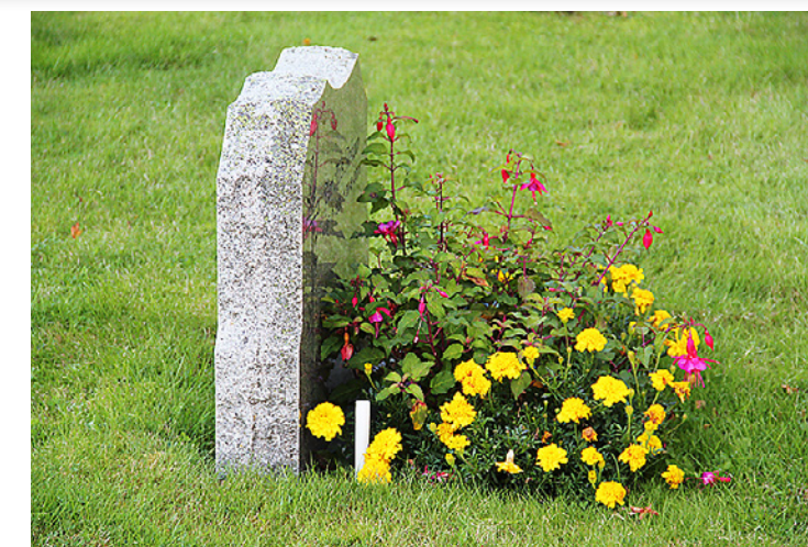
På dette gravstedet er det avtale om stell. Her er en av de gamle, hvite markeringspinnene.

– Hva betyr det i praksis at dere påtar dere dette ansvaret? – Stellet starter i begynnelsen